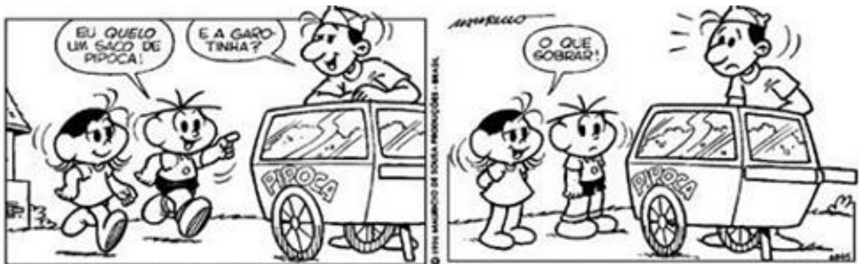
Copyright ©1999 Mauricio de Sousa Produções Ltda. Todos os direitos reservados.

LEIA A TIRINHA E RESPONDA ÀS QUESTÕES ABAIXO: